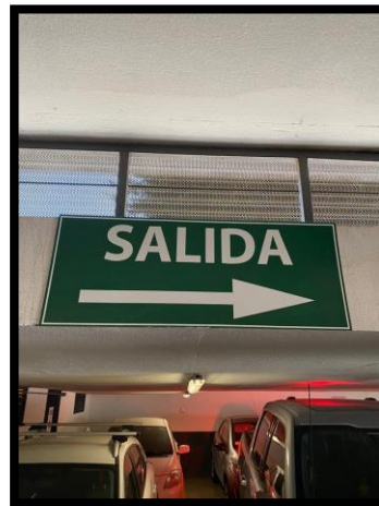
SEGUIR LA SEÑALETICA DE SALIDA DISTRIBUIDAS EN LOS ESTACIONAMIENTOS