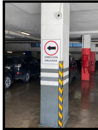
RESPECTAR LA DIRECCIÓN OBLIGATORIA